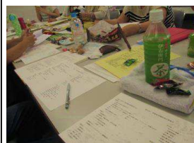
講座実行委員会の様子

6月28日(日)に5回目となる学童保育講座の実行委員会が行われました。今回は学童保育講座までの準備と当日の役割分担を決めます。また、今年度から山口県の事業として始まる放課後児童支援員資格認定研修について、山口県連協としてどこまで関わる事が可能なか確認しました。認定資格研修についてはまだ詳細はわかりませんが、年が明けてから始まる可能性も出てきています。このことについて、7月初旬に県担当課と懇談する予定です。