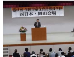
全国指導員学校の様子

職務を明らかにし、必要な仕事を学ぶことで、専門性の高い仕事だと意識していくことが必要です。実際に地域によっては30分前からの勤務しか認められないところもあり、十分な仕事ができない厳しい状況にあります。県連協として、運営指針を基に学習を進め、自治体への働きかけを強化していきたいと思えます。